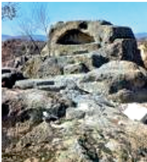
TATULA (Татула), asi 15 km východně od Matčina gradu (Момчилград) Dráčije (Дракије), dnešní Bulharsko.