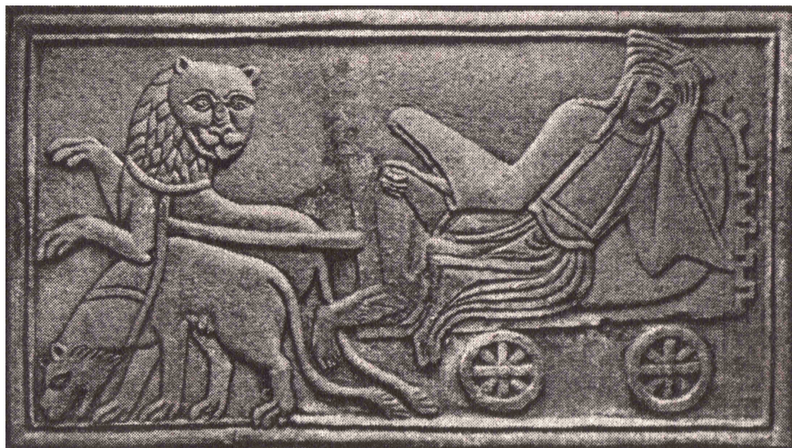
Dažbog a jeho nebeský povoz tažený lvi (Kyjevsko Pěčorská lávra).

Hovoříme-li o Apo_lionovi, vyprávíme si zároveň nejen o bájném preslovanském knížeti Jarovy (Jura, Jarylo, Džarylo, Žárilo), ale i o Vyšném vlchevci, Pěrunci Dažbogovi (Dajbog, Bohdal), jemuž je nebeský vůz prostředkem, hravě překonávajícím vzdálenosti skryt kamufláží schopnou nabývat pro oklamání pozorovatele neobyčejných podob: Mračna, Labutí, Delfinů, tedy i symbolu bájného ptáka Noha (Gryfa). Tak jako celé rodině matky Titánky Léty (Latony), bohyně z E_Settu (Božího Sedu, Bháša nagara) v Severiji. Bájný preslovanský kníže Jaro / Jura, Rudé Slunéčko, měl tedy (kolem roku 22 500 př. n. l.) nepochybně silný, více účelový stroj, schopný vynést do ovzduší i statného slona. Mnozí jej nazývali a dodnes nazývají Zlatým rounem, není-li však i toto tvrzení zastíracím manévrem.