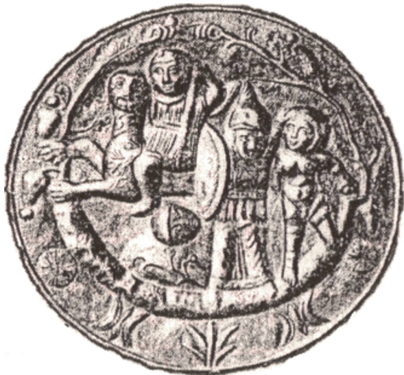
Dažbog na osedlaném lvu zabijí nepřítele Roxoláňský zlatý fals ze severské mohyly

Gryf (Griph)... Bájný pták Noh, létající fenomén ze středověkého, čistě romantického příběhu o Bruncvíkovi (viz Staré pověsti české - autor: prof. Alois Jirásek). Okřídlená a dnes již jen divoce vyhlížející mytologická bytost, nemající v českých dějinách zapomínání prý co pohledávat: Z poloviny opeřený dravec, z poloviny pozemský tvor: Orlí hlava s mohutným zobanem, z poloviny lev se čtyřmi tlapami vybavenými mohutnými drápy a určitě i nezbytným ocasem. V přeneseném významu: Mocná a bystrá síla vládající nebesa i zemi. Bájný pták Fénix / Věnik / Vjěstnik / Jaruda / Džaruda / Garuda i matka Sva.