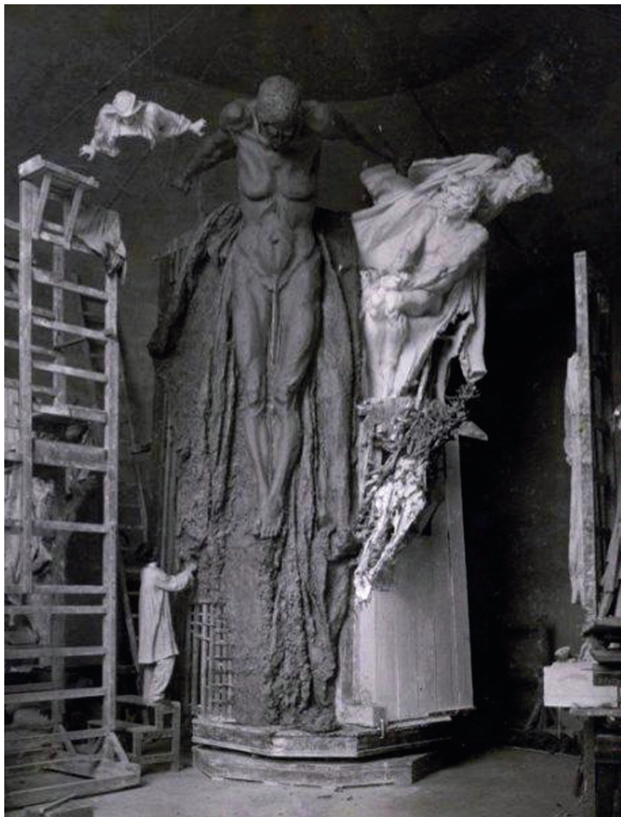
Původní studie „Stařena Historie“... Dobový snímek neznámého autora.